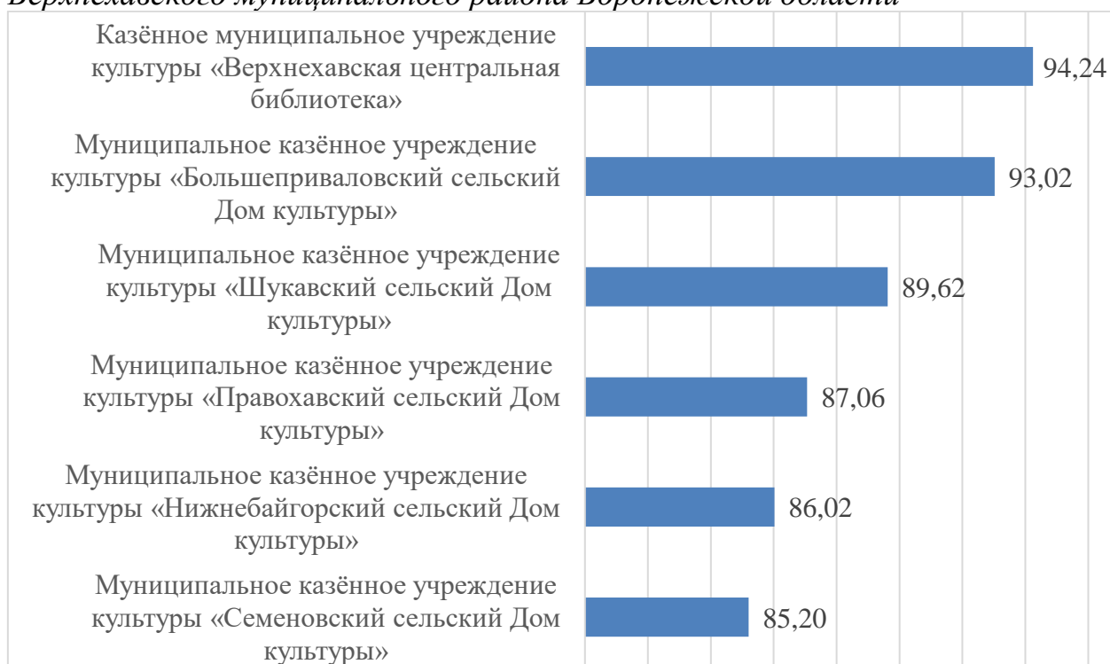
Гистограмма 1. Рейтинг по результатам сбора, обобщения и анализа информации о качестве условий оказания услуг организациями культуры Верхнехавского муниципального района Воронежской области